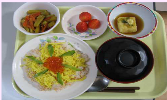
鮭ちらし：行事食です。