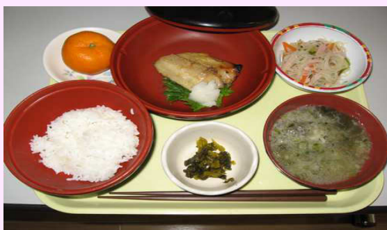
さわらの西京漬け：一例です。