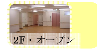
2F・オープン スペース